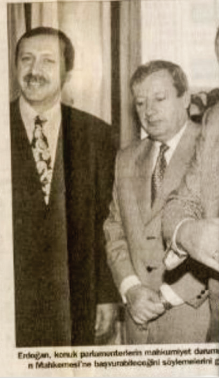
Erdoğan, konak parlamentörlere mahkumiyet kararının Mahkemesi'ne başvurabileceğini söylemelerini gördü.